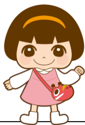
公式キャラクター はまなか あい