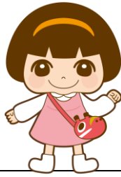
公式キャラクター はまなか あい