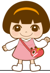
公式キャラクター はまなか あい