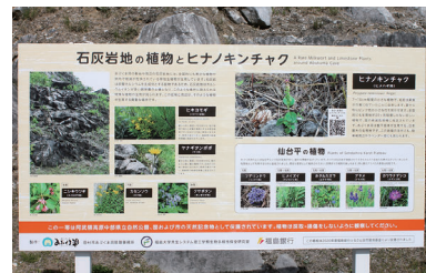
一般財団法人田村市滝根観光振興公社