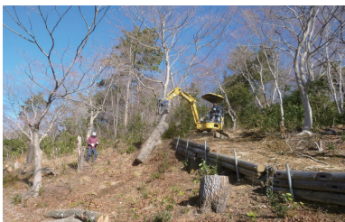
NPO法人いわきの森に親しむ会