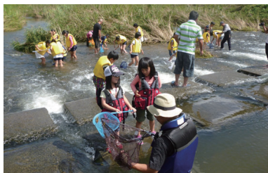
NPO法人小野自然倶楽部